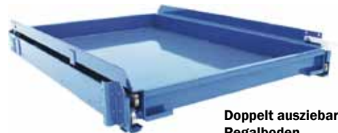
Doppelt ausziehbarer Regalboden