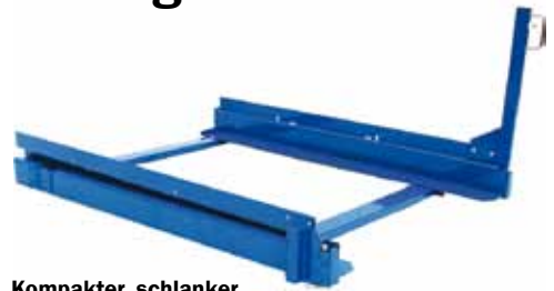
Kompakter, schlanker Auszug