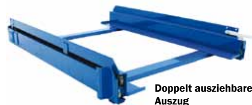
Doppelt ausziehbarer Auszug