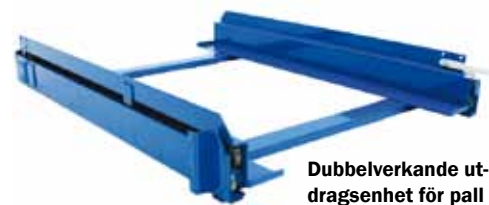
Dubbelverkande utdragsenhet för pall