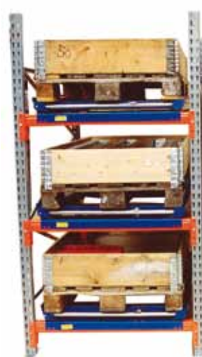
Bygghöjd med annat pallställ