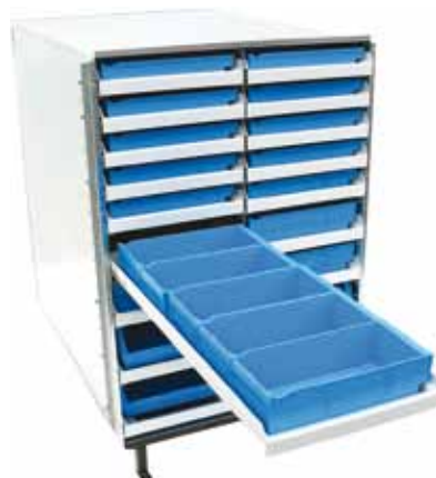
Lådorna passar perfekt i kassetterna.