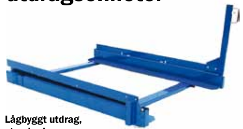
Lågbyggt utdrag, standard