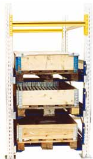
Bygghöjd med GBD pallställ