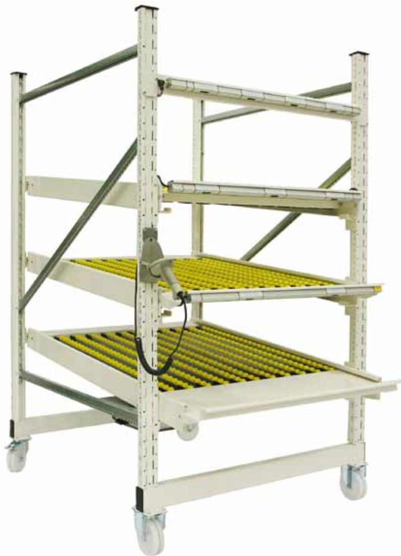
FIFO med Pick-to-Light